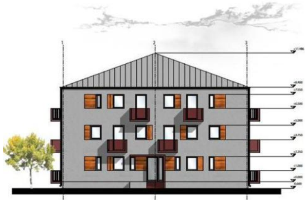
Pohľad fasády so vstupom.