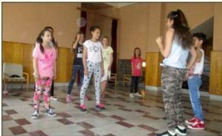
Táncitanítás gyerekek részére

2015 áprilisában közösségi központ nyílt Füleken. Fő céljai közé tartoznak: a helyi közösség tevékenységeinek támogatása a szociális készségek fejlesztése által; a szociálpatológiai jelenségek megelőzése; tanácsadás a közösség és a kliens szükségletei szerint; oktatói és sza-