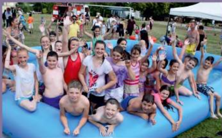
A medencében hűsölő gyereksereg

Idén június 13-án került megrendezésre iskolánkon a „Családi nap”. E rendhagyó, szórakoztató családi hétvége immár ötödik alkalommal vonzotta iskolánkra Fülek városának apraját-nagyját. Iskolánk nevelőtestülete és egyéb alkalmazottai, mint minden évben, ezút-