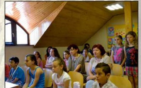
Alapiskolások a Nógrádi Turisztikai Információs Központban