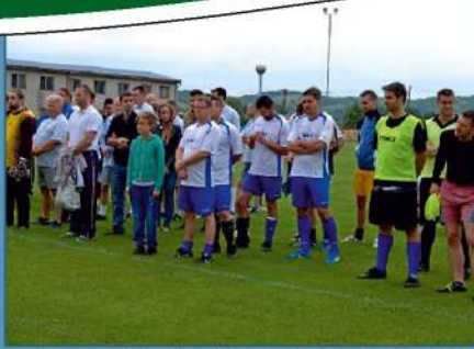
A résztvevő csapatok felsorakozása a mérkőzések előtt

A harmadik tornát a teke kedvelői számára rendezték. Az FTC-elnöki Kupa címért folyt a