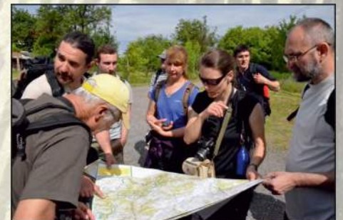
Vedená pešia túra