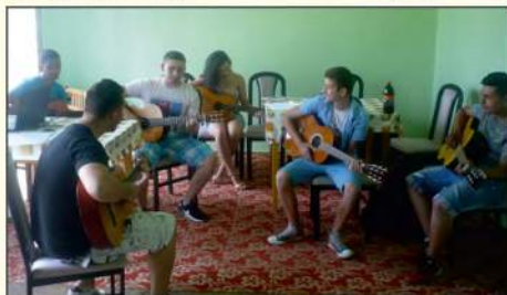
Výučba hry na gitare

V apríli 2015 vzniklo komunitné centrum vo Filakove. Jeho hlavným cieľom je podporovanie aktivít členov miestnej komunity prostredníctvom zvyšovania sociálnych zručností, prevencie a predchádzanie sociálno-patologických javov, poradenská činnosť pre potreby