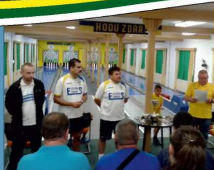
Vyhlasenie víťazov kolkárskeho turnaja