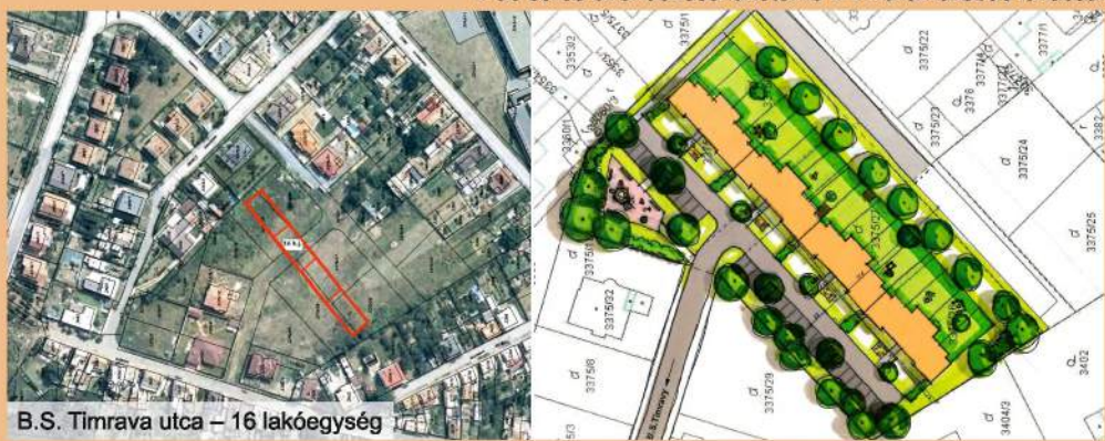
B.S. Timrava utca – 16 lakóegység

4 db soros elrendezésű lakótömb 4-4 háromszobás lakással