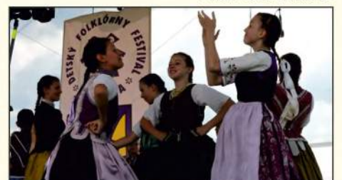
A Gyermek Néptáncgyűjtések Országos Versenyének győztes koreográfiája – Likavka