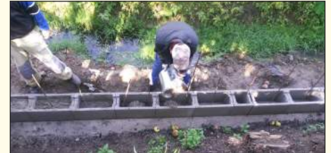
Stavba protipovodňovej zábrany v ulici I. Madácha

približne 30 metrov dlhú protipovodňovú zábranu. Do týchto prác sa zapojila aj jedna skupina občanov zapojených do verejných prác a taktiež aj Verejnoprospešné služby (VPS). Pre Dobrovoľný hasičský zbor mesta sa podarilo získať od Ministerstva vnútra okrem zrenovovaného požiarického auta Triera aj protipovodňový vozík, ktorý obsahuje tri rozličné typy čerpadiel veľmi užitočných pre prácu dobrovoľných hasičov.