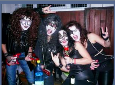
Filakovský koncert svetoznámej rockovej kapely KISS