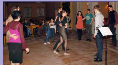
Neváhajte, a naučte sa základy swingového tanca lindy hop

Na koho sa ešte môžete tešiť v rámci podujatia KLUB 2017? Koncom júna nás navštívi Steve