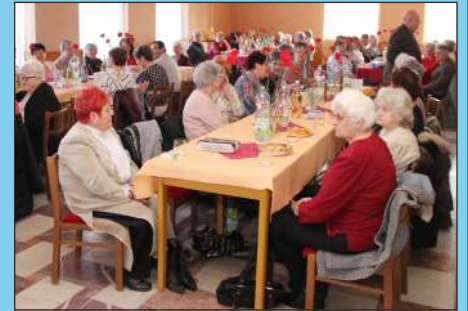
Dobrá spoločnosť sa bavila aj pri stoloch