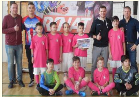
Gyermekbajnokság a Papréti Szlovák Tannyelvű Alapiskolában

Minden labdarúgónak megvan az álma. Hol látod magad pár év múlva?