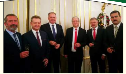
Agócs Attila polgármester (jobbra) újévi fogadáson Andrej Kiska köztársasági elnök úrnál (balról a harmadik) Illésháza, Dunaszerdahely, Komárom és Párkány polgármesterével.

További előrelépéseket sikerült megvalósítani a füleki sportélet területén is. Pályázati források felhasználásával megújult az FTC stadion atlétikai infrastruktúrája, és a Szlovák Labdarúgó Szövetségen keresztül az Oktatási Minisztériumtól 25 ezer eurós támogatást kaptunk a stadion tornatermének felújítására. A munkák előreláthatólag tavasszal kezdődhetnek meg. A város segít