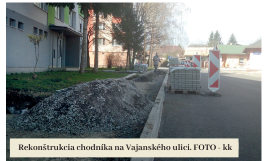
Rekonštrukcia chodníka na Vajanského ulici.