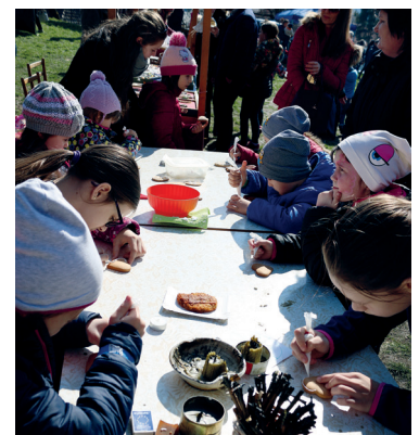
Návštevníci si mohli vyskúšať zhotovenie kraslíc rôznymi technikami, plstenie, zdobenie medovníkov a viazanie pátky.