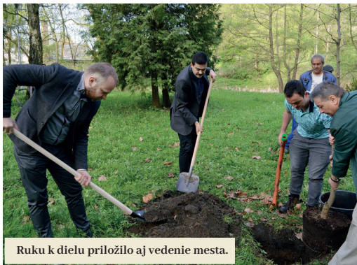
Ruku k dielu priložilo aj vedenie mesta.