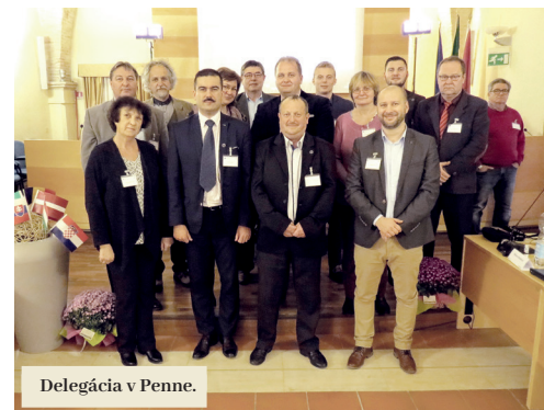
Delegácia v Penne.

ENSIE je projekt, ktorého cieľom je vytvoriť platformu na prezentáciu príkladov dobrej praxe, výmenu know-how a hľadanie efektívnych riešení v oblasti sociálneho podnikania či pracovnej in-