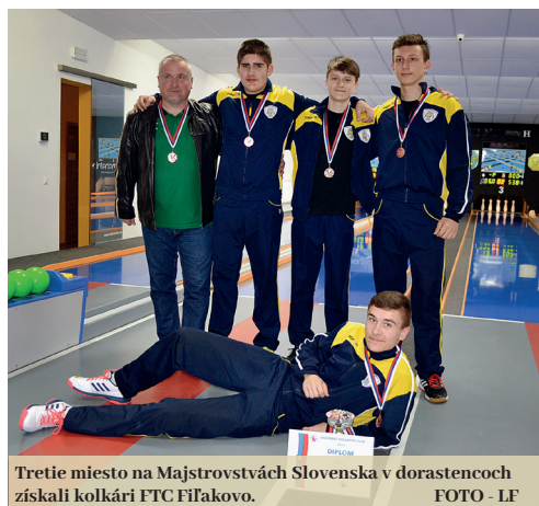
Tretie miesto na Majstrovstvách Slovenska v dorastencoch získali kolkári FTC Fiľakovo.