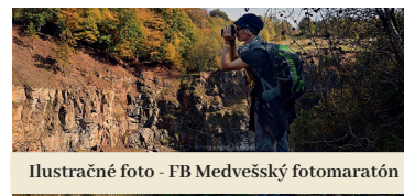
Ilustračné foto - FB Medvešský fotomaratón