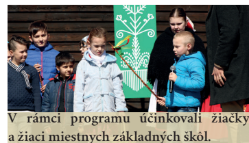
V rámci programu účinkovali žiačky a ziaci miestnych základných škôl.

13. ročník Palóckej Veľkej noci na Fiľakovskom hrade prilákal viac ako 1 500 návštevníkov - podujatie dosiahlo najväčšiu návštevnosť vo svojej histórii. Organizátor: MsKS vo Fiľakove, spoluorganizátori: HMF, MO Csemadok Fiľakovo a VPS Fiľakovo.