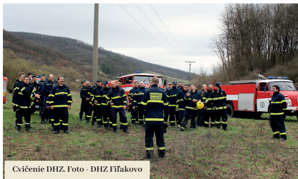
Cvičenie DHZ.