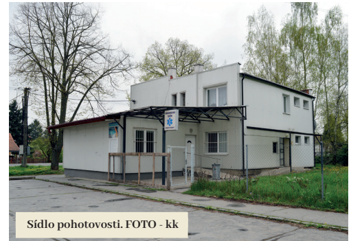
Sídlo pohotovosti.

Žiadosť o udelenie výnimky pre Fiľakovo podpísali okrem primátora aj starostovia obcí Biskupice, Belina, Bulhary, Buzitka, Čakanovce, Čamovce,