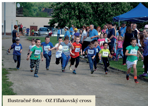
Ilustračné foto - OZ Fiľakovský cross