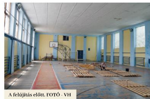
A felújítás előtt.

Elmondása szerint azonban a tornaterem komplex felújítása ez évben nem egyedüli beruházás a stadion területén. A tekepálya feletti helyiségek közül is fel lett újítva néhány, mivel a művelődési központ