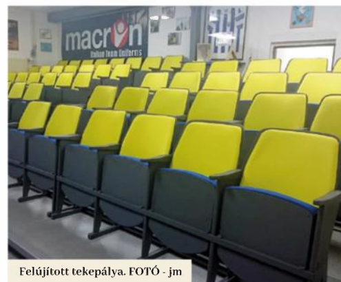
Felújított tekepálya.