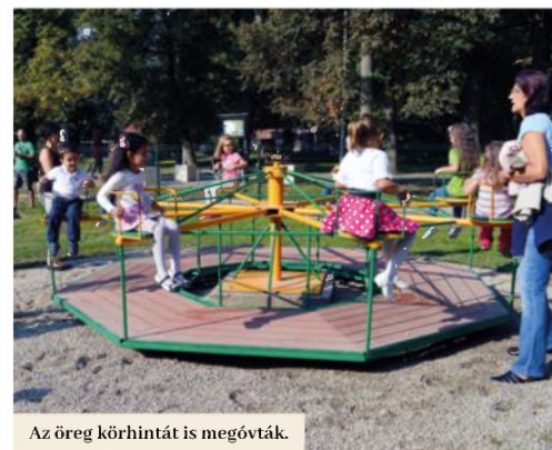
Az öreg körhintát is megóvták.