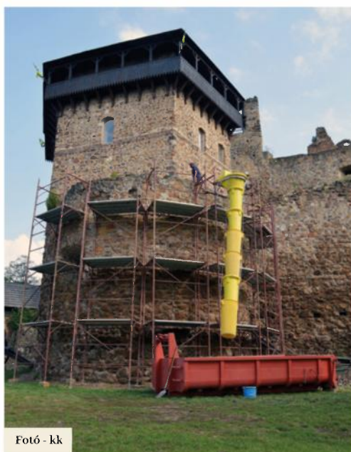
Fotó - kk

Az ágyúbástya ez idáig nem volt kihasználva az idegenforgalmon belül. A polgármester elmondása szerint a múltban alkalmanként ideiglenes öltöző-