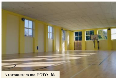
A tornaterem ma.

Ahogy folytatta, a munkák megkezdése után állapították meg, hogy a tornaterem komolyabb alapok nélkül, kőtörmeléken épült. Azonkívül az épület egy kisebb „időszakos” patak közelében áll, amely közvetlenül a nagy tribün alatt folyik. „Emiatt nedvesedtek a falak. Megállapítottuk, hogy nem elég csupán alávágni a falat, kénytelenek voltunk az épületet komolyabban leszigetelni.” Ezért az egyik falhoz szigetelő falat kellett