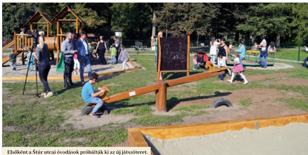
Elsőként a Stúr utcai óvodások próbálták ki az új játszóteret.

A szülők és csemetéik okkal örülhetnek. Szeptember 21-én, pénteken, hivatalosan átadták részükre a füleki park felújított gyermekjátszóterét. A játszótér új játékelemekkel bővült, és új életre keltették a régi körhintát is. A revitalizáció megközelítőleg 25 ezer euróba került.