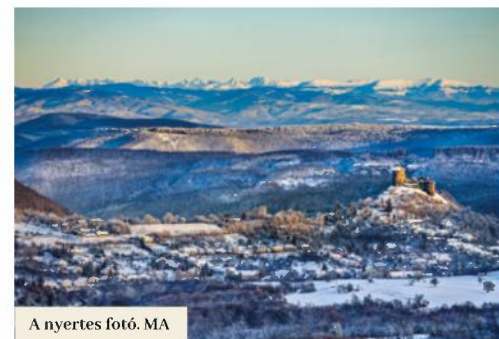
A nyertes fotó. MA

Elmondása szerint egy ilyen képet készíteni egyáltalán nem volt könnyű. „A fénykép egy téli napon készült. Mint már sokszor, azon a napon is elindultam kerékpárral Fülekről a salgói várba, habár a hőmérséklet mélyen a fagypont alatt volt. A Magas-Tátrát nem látni erről a helyről minden nap, a fotó készítésével nagyon megszenvedtem, de megérte” – tette hozzá a tehetséges fényképész, akinek képeire már többször felgyeltek a régiókon kívül is. „Fényképeimet már többször bemutatták a magyar nyelvű időjárás-jelentő műsorban. A „Čarovné Slovensko” kiadótól oklevelet kaptam és a „Čarovné Tatry a Zamagurie” című könyvben szintén megjelent a felvételem” – mondta zárszóként.