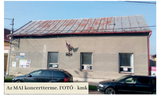
Az MAI koncertterme.

Az önkormányzat úgy döntött, hogy a felújítást tovább folytatják, és visszaadják az épület történelmi jellegét. Az előzetes tervek szerint hozzávetőleg 65 ezer eurót investálnak bele. Abból a város 12 ezret a LEADER helyi akciócsoport pályázati felhívása által akar megszerezni, amelybe az elkövetkező hetek során fog bekapcsolódni. „A támogatásból ásványgyapattal akarjuk hőszigetelni a homlokzat fennmaradó részét, visszaállítjuk a történelmi ablakkereteket és az ablakok közti díszítőelemeket is. Történelmi vakolatot viszünk fel rá. A Koháry tér felől fa bejárati ajtót építünk be, és kicseréljük a piac felőli ajtót” – sorolta. Az önkormányzat saját pénzből fogja megvalósítani a falak alávágását, új, szigetelt padlózatot raknak le, meg-