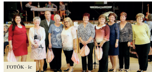
FOTÓK - ic

A városvezetés, valamint a Városi Hivatal mellett működő Polgári Ügyek Testülete már több évtizede szervezi meg a jubilánsok ünnepségét. Hagyománnyá vált, hogy minden év októberében a Városi Hivatal vendégül látja a 75., 80. és 85. életévüket betöltött, vagy még az ez évben betöltendő jubilánsokat, hogy a város vezetősége személyesen is felköszönhesse őket. A meghívottak száma idén meghaladta a 130 főt, így október 24-én 80 fő vett részt a két csoportra osztott ünnepségen. A város legkisebjei és a Művészeti Alapiskola növendékei ünnepi műsorral köszöntötték őket. A város polgármestere megköszönte a közösségünkért tett munkájukat, valamint sok erőt, egészséget kívánt nekik családjuk körében. Az ünnepeleltek a Polgári Ügyek Testületének tagjaitól vehették át ajándékosomagjaikat, majd aláírták a város emlékkönyvét. Azon jubilánsok ajándékosomagjait, akik egészségügyi okok miatt nem tudtak részt venni az ünnepségen, családtagjaik vehetik át a novemberi hónap folyamán.