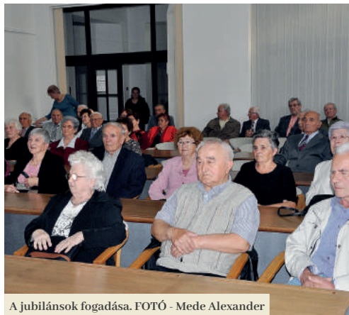
A jubilánsok fogadása.