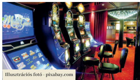
Illusztrációs fotó - pixabay.com

Ez év márciusában új törvény lépett érvénybe Szlovákiában a hazárdjátékokról. A jogszabály értelmében az önkormányzatok az eddiginél több napra rendelkezhetnek a játékterem zárva tartásával. Ezt kihasználva szavazta meg a városi képviselő-testület azt, hogy az eddigi három nap helyett a játékterem az év további 12 napján is zárva lesznek. A jövő évtől így Füleken már nem nyithatnak ki a karácsonyi ünnepek három napján, január 6-án, május 1-jén és 8-án, a húsvéti ünnepek alatt (pénteken, vasárnap és hétfőn), július 5-én, augusztus 29-én, szeptember 1-jén és 15-én, valamint november 1-jén és 17-én. „Szükségét érezzük a hazárd visszaszorításának a városban. Érzékeljük a súlyos szociális hatását az egyes családokra, melyekben játékfüggő személyek élnek” – indokolta meg Agócs Attila polgármester.