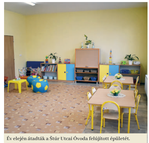
Év elején átadták a Sűrű Utcai Óvoda felújított épületét.