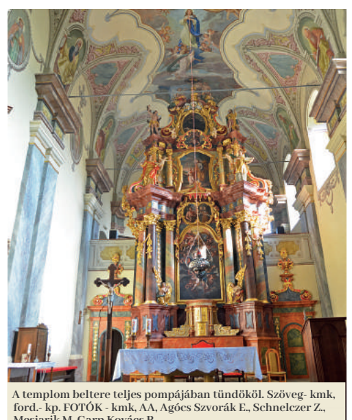
A templom beltere teljes pompájában tündököl. Szöveg- kmk, ford.- kp.