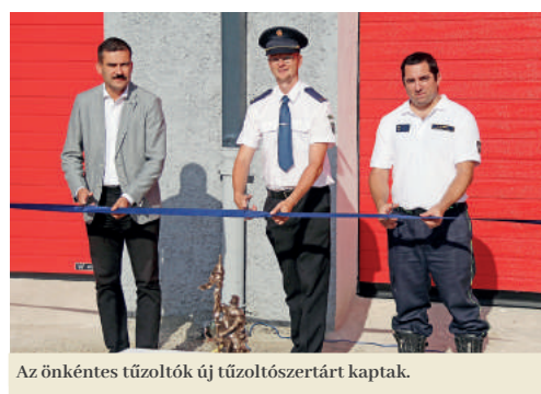
Az önkéntes tűzoltók új tűzoltószertárt kaptak.