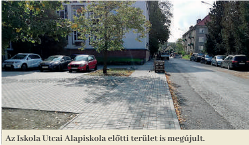
Az Iskola Utcai Alapiskola előtti terület is megújult.