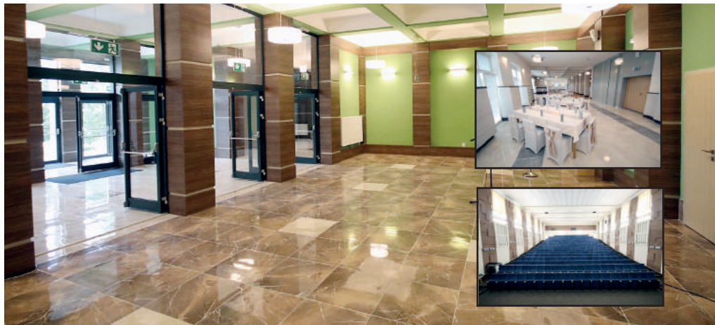
A leginkább várt beruházás talán a VMK épületének felújítása volt. Megújult a beltér és a vezetékek is.