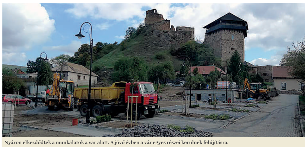
Nyáron elkezdődtek a munkálatok a vár alatt. A jövő évben a vár egyes részei kerülnek felújításra.