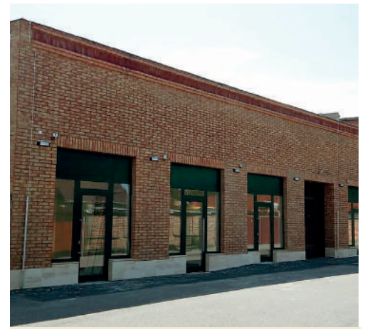
A Piac utcán új városi piaccsarnok épült.