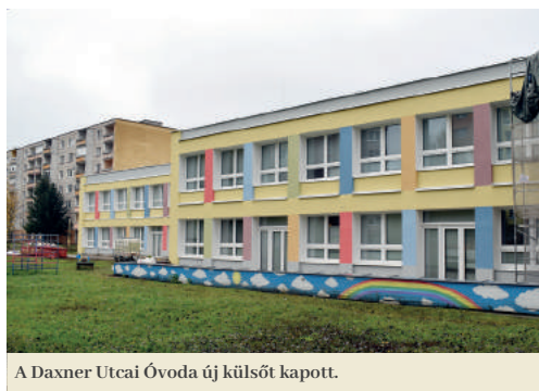
A Daxner Utcai Óvoda új külsőt kapott.