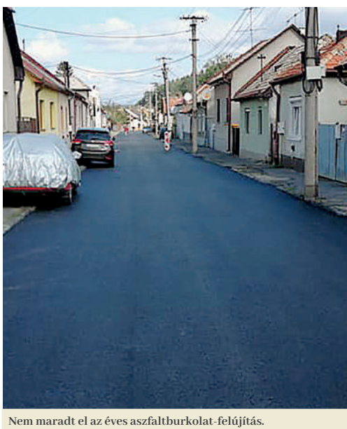
Nem maradt el az éves aszfaltburkolat-felújítás.