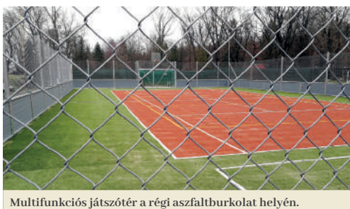
Multifunkciós játszótér a régi aszfaltburkolat helyén.