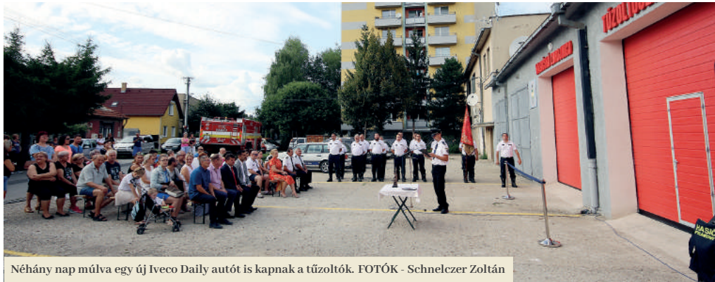
Néhány nap múlva egy új Iveco Daily autót is kapnak a tűzoltók.

Az önkéntes tűzoltóknak új székhelye van. A város felújította számukra a Filbyt városi lakáskezelő vállalat garázs helyiségeit. Az önkormányzat csaknem 30 ezer eurós támogatást hívott le erre a célra az SZK Belügyminisztériumától. Az új tűzoltószertárt a Városnapok alkalmával adták át.