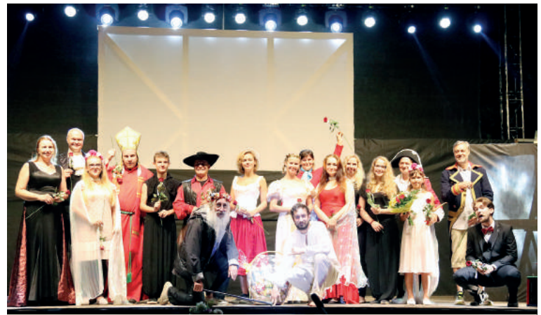
Az előadás nyilvános főpróbájára kétszáz néző előtt került sor.