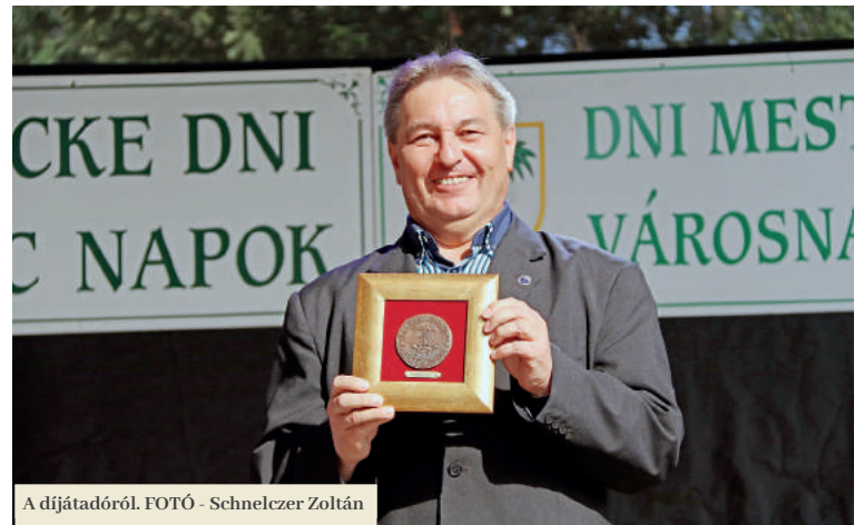
A díjátadóról.