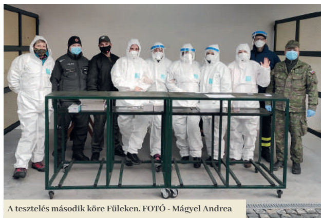
A tesztelés második köre Füleken.

A két nap során 5609 embertől vettek mintát, s 29 fertőzöttet találtak. „A tesztelés nagy kihívást jelentett számunkra. Szeretnék köszönetet mondani mindenkinek, aki bármilyen formában hozzájárult ahhoz, hogy a tesztelés sikeresen menjen végbe. Hálás vagyok az egészségügyi dolgozóknak, akik kellő létszámban jelentkeztek, s a hétvége alatt több mint 24 órát dolgoztak családjuk, szabadidejük rovására. Köszönetet mondok a Városi Hivatal és az egyes városi intézmények dolgozóinak, valamint az önkéntes tűzoltóknak az adminisztratív feladatok ellátásában végzett munkájukért, mellyel hozzájárultak a tesztelés problémamentes lebonyolításához. Köszönet illeti a hadsereget, amely a rendelkezésre álló nagyon szűkös időkeret ellenére biztosította a teszteléshez szükséges eszközöket. Köszönet illeti az állami és a városi rendőrséget, valamint a roma polgárőrség tagjait, akik a két nap során ügyeltek a rendre. Külön köszönetet érdemelnek azok a helyi vállalkozók és szponzorok, akik átérzve a helyzet fontosságát anyagilag, illetve különféle szolgáltatásokkal segítettek a sikeres lebonyolításban. Köszönetünket fejezzük ki Rubint István vállalkozónak, aki térítésmentesen biztosította az ebédet a két nap során a tesztelést végző csapatoknak. Hálásak va-