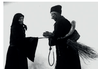
Pásztorok karácsonyi vesszőhordása

Vidékünk legismertebb és egyik legtovább fennmaradt karácsonyi szokása a betlehemezés. Többszereplős, dramatikus misztériumjáték, fő kelléke a jászol vagy templom alakú betlehem, szereplői az angyalok, pásztorok, és az általában Gubónak nevezett öreg. A hosszas előkészületet és gyakorlást igénylő játékot gyerekekből vagy legényekből álló 4-5 fős csapat adta elő, a pásztorjáték fő mozzanatai pedig a következők voltak: beköszöntő, tréfálkozás a süket öreg pásztorral, pásztorok indulása Betlehembe, adománykérés. Pásztorokhoz kötődött a karácsonyi vesszőhordás hagyománya is. Leginkább karácsony vigíliáján a juhászok, csordások, kondások vesszőkkel járták vé-