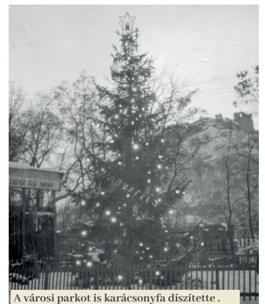
A városi parkot is karácsonyfá díszítette .