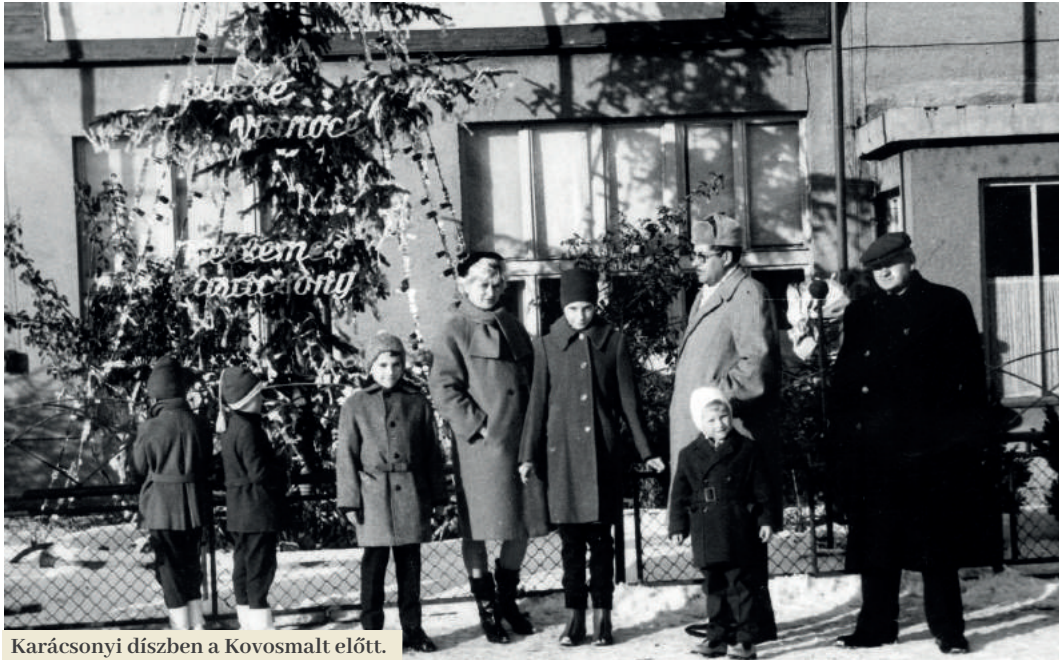
Karácsonyi díszben a Kovosmalt előtt.