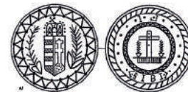
Kalondai ostyasütő vasminta, forrás - Tátrai Zsuzsanna - Karácsony Molnár Erika - Jeles napok, ünnepi szokások

gig az állattartó gazdák házait, a gazdasszony kötevényét megfogva húzott a vesszőkből, melyet a sarokba tett, és tavasszal ezzel hajtotta ki az állatokat. Ezzel a rítussal az állatok következő évi egészségét szándékoztak bebiztosítani. A pásztorok az úgynevezett aprószentek-vesszőért bort, kenyert, esetleg pénzt kaptak. A vesszőhordás fontos mozzanata volt a háziak rigmusba öntött jókívánságokkal való köszöntése. Egy Órhalomban gyűjtött köszöntővel kívánunk magunk is áldott karácsonyi ünnepeket és boldog új esztendőt minden kedves olvasónknak: Szerencsés ünnepeket kívánunk kendteknek! Több jóval, egészséggel mulatassák Krisztus Urunk születése napját! Adjon Isten bort, búzát, békességet, országunkban megmaradást, holtunk után léleküdvösséget!