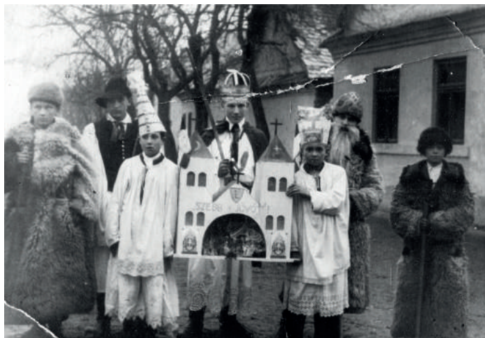
Püspöki betlehemek az 1950-as évek végén

Az adventi csendet Szent Miklós (december 6.) ünnepének előestéje törte meg. Ilyenkor „maskara-csapat” járta végig a falut – láncos Miklós és kísérete: a kántor, az angyal, a ministránsok és az ördögök. A fonó-, fosztóbeli lányokat „gyóntatták”. Akit bűnösnek ítélt meg Miklós, azt az ördögök félholtra táncoltatták, majd az alakoskodó játék végén a ministránsok parázsra szórt törött paprikával füstölték végig a társaságot. Luca napja (december 13.) a magyar néphagyomány egyik legjelesebb napja. Ez a nap éppúgy alkalmas volt termékenységarázslásra, mint házasság-, halál- és időjárásjóslásra, bizonyos női munkák tiltására, alakoskodásra, tréfálkozásra, valamint a lucaszék készítésére. Vidékünkön még az 1950-es években is jártak lucázni a fiúgyerekek; házról házra járva termékenységarázsló rigmusokat, verseket mondtak. Elterjedt volt az almával való jóslás: karácsonyig minden nap haraptak belőle, majd a maradékkal az éjfél misére mentek, s úgy vélték, olyan nevé lesz a férjük, mint az első férfi, akivel ilyenkor találkozunk. A névre való tudakozás másik ismert módja a „lucacédula” készí-