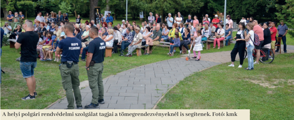
A helyi polgári rendvédelmi szolgálat tagjai a tömegrendezvényeknél is segítenek.

A Helyi Polgárőrség Program (MOPS), múltbéli ismertebb nevén roma polgárőrség, idén júniusban befejeződik. A folytatást illetően kérdéses, hogy egyáltalán lesz-e, s ha igen, milyen formában. Füleken bizonytalanná vált a polgárőrség 10 alkalmazottjának sorsa, s országsszerte százak veszíthetik el munkájukat.