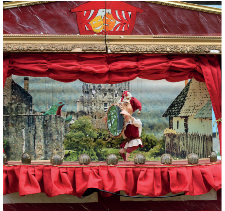
A Divadlo z domčeka a Hogyan vált Gáspárból kis híján király című mesét mutatta be. A színészek hagyományos bábokkal játszottak, ami még érdekesebbé tette az előadást.