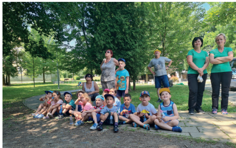
Június 25-én, péntek délelőtt, a város a helyi alapiskolákat és óvodákat látogató gyerekek számára készített programot. Láthatták a vörös tölgy ültetését, és hogy milyen a hegymászó technikával történő fametszés.