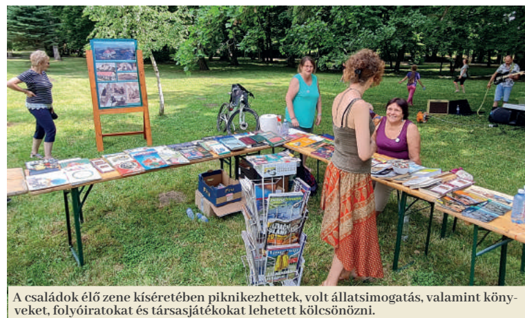
A családok élő zene kíséretében piknikezhettek, volt állatsimogatás, valamint könyveket, folyóiratokat és társasjátékokat lehetett kölcsönözni.