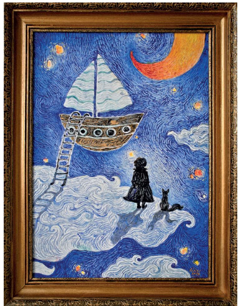
A mű címe: A kis herceg .