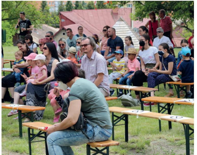
A gyermekközönség élvezte a szórakoztató programokat. A szülők is érdeklődéssel figyelték az előadásokat, és néhány jeleneten jókat nevettek a gyerekekkel együtt.