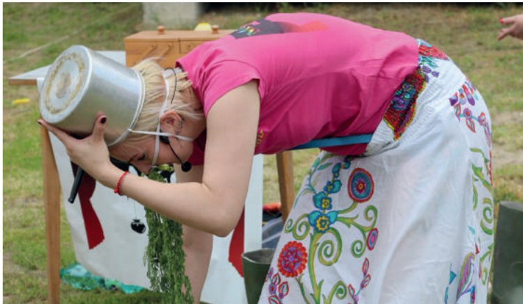
A MeseFigurák bábszínház interaktív előadást mutatott be magyar nyelven. A tölük megszokott humorral és kreativitással dolgozták fel a meséket.