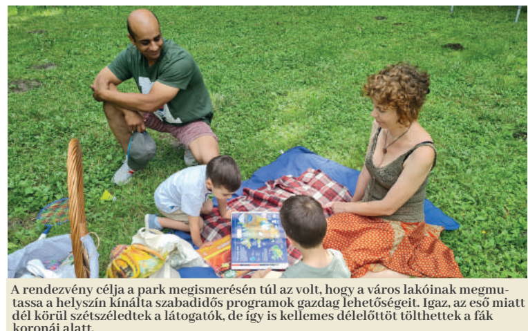
A rendezvény célja a park megismerésén túl az volt, hogy a város lakóinak megmutassa a helyszín kínálta szabadidős programok gazdag lehetőségeit. Igaz, az eső miatt dél körül szétszéledtek a látogatók, de így is kellemes délelőttöt tölthettek a fák koronái alatt.