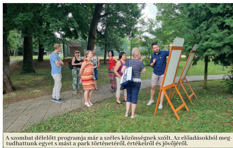
A szombat délelőtti programja már a széles közönségnek szólt. Az előadásokból megtudhattunk egyet s mást a park történetéről, értékeiről és jövőjéről.