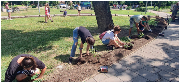
A városi kertészet dolgozóinak segítségével a gyerekek rózsát és levendulát ültettek.