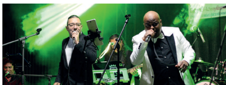
Záver dvojdnového festivalu patrilo latinskoamerickej kapele Orquesta La Mecánica. Temperamentné nočné vystúpenie hudobníkov z Kuby, Tenerife a Venezuely roztančovalo celý dvor múzea, za čo si od publika vyslúžili dlhé ovácie.