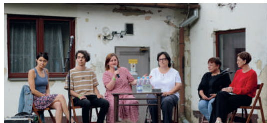
Piatkový program sa niesol v znamení besied venovaných vydavateľstvu Kalligram a knihe Samko Tále. Kniha o cintoríne. Súčasťou prvého dňa bolo aj premietanie filmu Kama a koncerty skupín Pázsit, Pressburg Saxophone Quartet či Lóci Játszik. Text - kmk, foto - MsKS, Zoltán Schnelczler

Po dvoch rokoch sa Mestskému kultúrnemu stredisku vo Fiľakove opäť podarilo zorganizovať obľúbený multizánrový festival UDVart. Hoci sa kvôli protiepidemickým opatreniam musel tento rok obísť bez sprievodných podujatí či hier, za čo si vyslúžil prívlastok „v kufri“, návštevníkom ponúkol zaujímavý program. Festival podporili Fond na podporu kultúry národnostných menšín, Fond na podporu umenia aj Fond malých projektov programu spolupráce Interreg V-A Slovenská republika – Maďarsko, vďaka čomu bol v tomto roku vstup na festival počas oboch dní bezplatný.