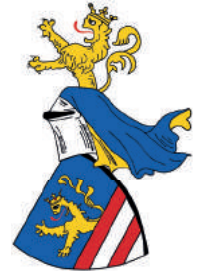
Erb Kacsicsovcov.

O zlodušnosti Fulka sa zachovala aj ďalšia legenda, podľa ktorej