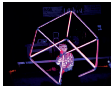
Po zotmení si diváci mohli vychutnať kvalitnú UV šou s akrobatickým tancom skupiny Vertigo.