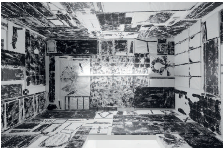
Unfolded Territories, Chimera-Project Gallery, Budapešť, Maďarsko