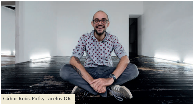
Gábor Koós.