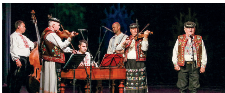
V piatok sa divákovi predstavili LH DOBRODA či LH ĎATELINKA, ktorá oslávila svoje 50. narodeniny. V programe účinkovali aj FS Rakonca a Jánošík, storočný filakovský mužský spevácky zbor Pro Kultúra a ženský spevácky zbor Melódia.