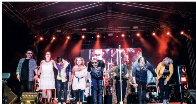
V sobotu večer na hradnom námestí zneli tóny skladieb od OCHO MACHO, po ktorých nasledovala legendárna skupina NEOTON FAMILIA Sztárjai. Medzi dvomi koncertmi divákov zabávala bubnová sú Campana Batucada.