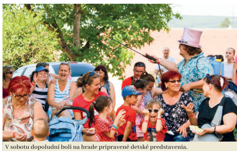
V sobotu dopoludní boli na hrade pripravené detské predstavenia.