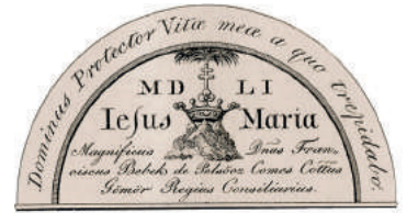
Kresba nápisovej tabule s Bebekovským erbom, ktorá bola osadená nad vstupnou bránou do hradu.