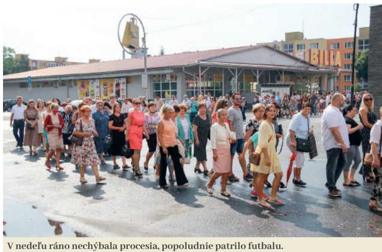
V nedeľu ráno nechýbala procesia, popoludnie patrilo futbalu.