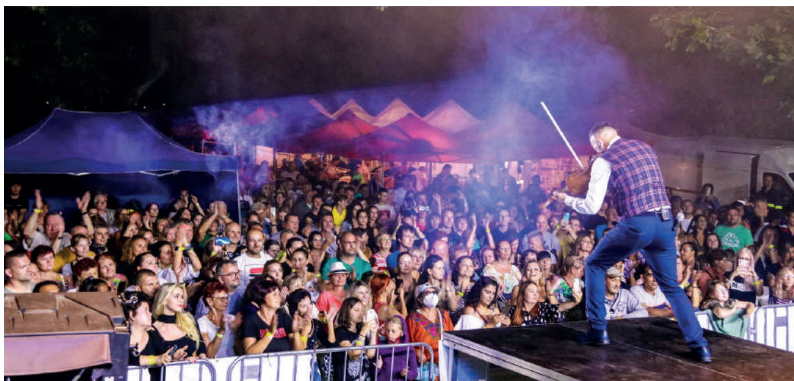
Neodmysliteľnou súčasťou Dní mesta sú tradičné večerné koncerty na hrade. Obrovský záujem u divákov vzbudil piatkový koncert obľúbenej skupiny Kandráčovci. Vystúpenie si prišlo pozrieť približne 850 ľudí.