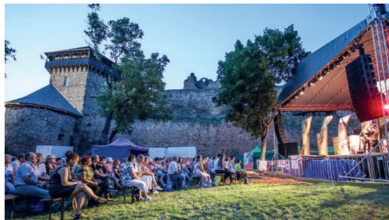
Sériu programov v nedeľu večer na hradnom nádvorí uzavrelo operetné predstavenie Cigánska láska (Cigányszerelem) od Franza Lehára. Text - kmk, MsKS.