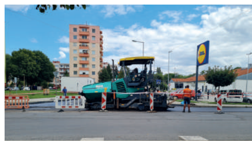
Pred Lidlom vznikajú nové parkovacie miesta.

Počas najbližších dní tak dostane nový asfaltový povrch Ulica 1. mája, ktorá patrí k najdlhším a najfrekventovanejším v meste. „Na to nadväzuje aj obnova neďalekej Kukučínovej ulice a vyasfaltujeme tiež časť Mocsáryho ulice, ktorá spája spomenuté dva úseky.“ Okrem ciest tiež mesto vybuduje päť nových pozdĺžnych parkovacích miest pred obchodom Lidl