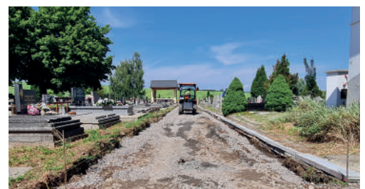
Rozsiahlou rekonštrukciou prechádza aj cintorín.