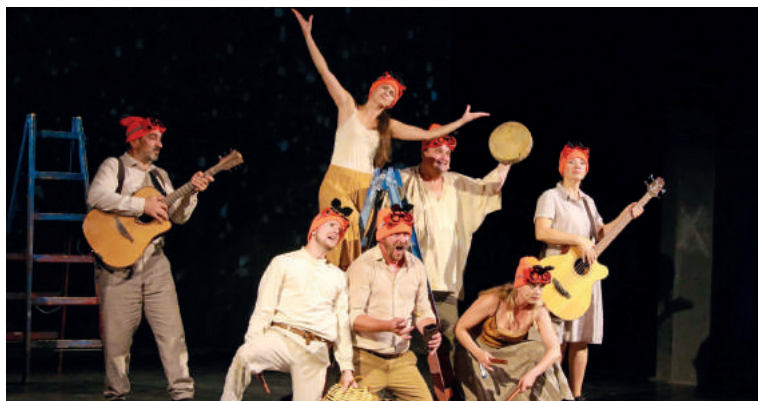
Vďaka cezhraničnému programu RETOUR Miskolc – Filakovo. Čo je v kufri? si v zrekonštruovanej divadelnej sále MskKS mohli vo štvrtok vychutnať komédiu Pán Ström v podaní RADOŠINSKÉHO NAIVNÉHO DIVADLA. Humorné, ale i poučné dielo "radošinci" predviedli pred plnou sálou.

Od 12. do 15. augusta žilo mesto oslavami dvojitého jubilea – 775. výročia prvej písomnej zmienky o Filakove a 30. ročníka série podujatí Palócke dni. Štvordňový festival okrem tradičných podujatí priniesol aj niekoľko novinek. Obyvatelia mesta si mohli vychutnať koncerty, divadelné predstavenie, operetu, interaktívne prechádzky mestom či detské predstavenia. Program bol prispôbený slovenskému, maďarskému i rómskemu publiku, na svoje si prišli všetci od najmenších až po seniorov. Podujatie vzniklo s podporou Fondu na podporu kultúry národnostných menšín, Banskobystrického samosprávneho kraja a Fondu malých projektov Interreg V-A Slovensko – Maďarsko.