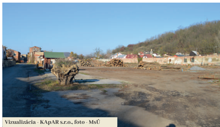
Vizualizácia - KAPAR s.r.o.

mický rozvoj a zvýšenie zamestnanosti v prihraničnom území Novohradu investičnou výstavbou a rozvojom miestnej infraštruktúry. Vo Filakove má byť v rámci projektu zrevitalizovaná časť schátranej priemyselnej zóny. Vyrásť tu má nová 2000 m 2 rozľahlá výrobná hala so skladovými priestormi určená pre ľahký prie-