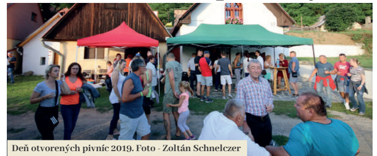
Deň otvorených pivníc 2019.

Dôležité sú podmienky na jeho dozrievanie a prísne výrobné postupy. V našich pieskovcových pivniciach je celoročne stála vlhkosť a teploty sa držia v zime aj v lete okolo 10 -11 °C, takže hlav-