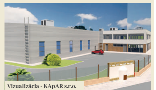
Vizualizácia - KAPAR s.r.o.

Podrobné podmienky súťaže sú dostupné na www.filakovo.sk alebo na mestskom úrade na