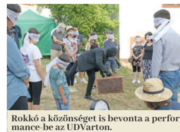
Rokkó a közönséget is bevonta a performance-be az UDVarfesztyiválon.