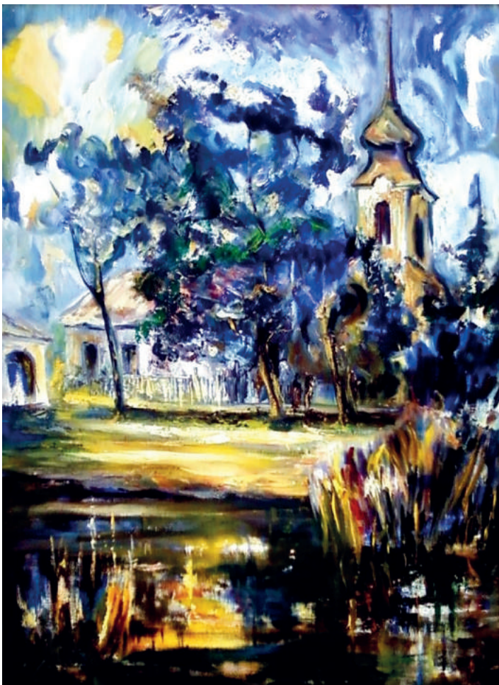
A mű címe: Martosi fények (olaj - vászon)