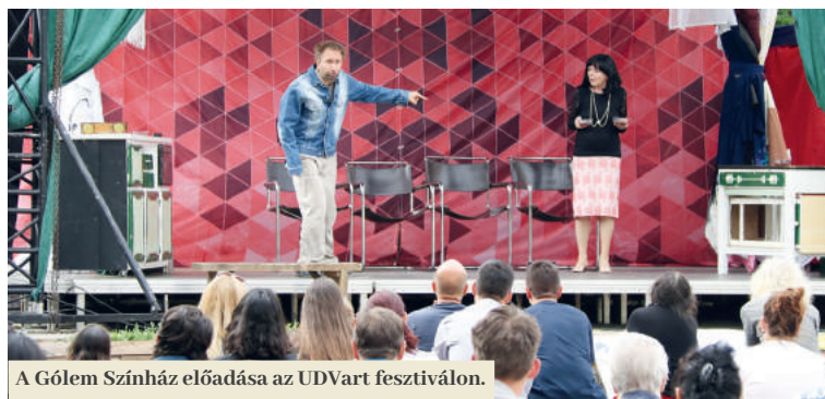
A Gólem Színház előadása az UDVarfesztyiválon.