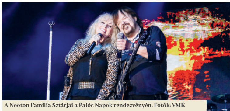
A Neoton Família Sztárjai a Palóc Napok rendezvényén.

A város által támogatott csoportok közül a Melódia, a Pro Kultúra, a Rakonca, a Kis Rakonca, a Jánošík gyermek- és felnőtt csoportja, valamint a File Banda is közönség elé tudott lépni az elmúlt évben. A két énekkar részt vett a XVIII. Kodály Napokon, Galántán, a Rakonca és Kis Rakonca pedig a Szlovákiai Magyar Néptáncosok Szakmai Minősítő Gáláján, Zselízen, ahol mindkét táncgyüttes minősített csoportként végzett. A VMK két másik csoportja, a MeseFigurák Báb-színház és a Foncsik Énekegyüttes is folytatta a munkát, utóbbi a Vass Lajos Népzenei Verseny nemzetközi döntőjében elnyerte