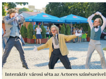
Interaktív városi séta az Actores színészeivel.