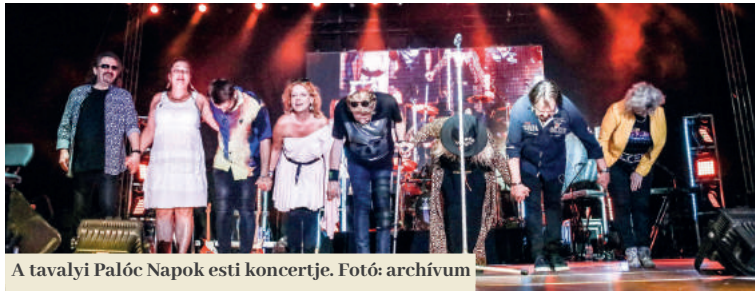
A tavalyi Palóc Napok esti koncertje.

I dén is nagyszerű koncertekre számíthatnak a látogatók a hagyományos Palóc Napok és Füleki Városnapok alatt, amely 2022. augusztus 12-15. között valósul meg.