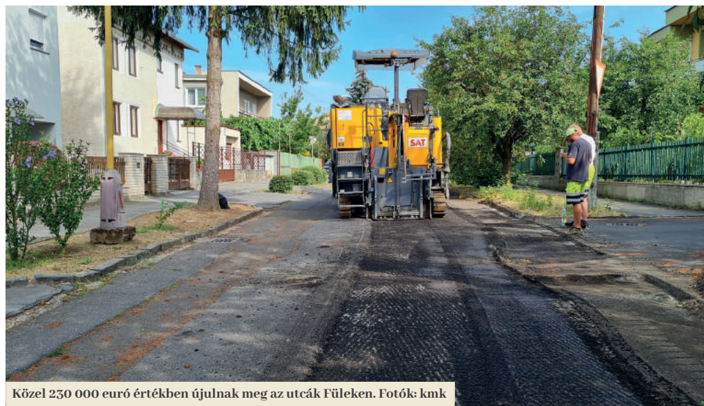
Közel 230 000 euró értékben újulnak meg az utcák Füleken.