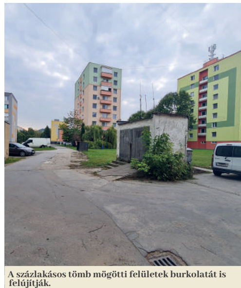
A százlakásos tömb mögötti felületek burkolatát is felújítják.

Füleken júliusban elindultak az előkészületek az utak és egyéb területek nagyobb kiterjedésű aszfaltozására. A következő hetekben hét utcában állítják helyre az útfelszínt. Komplex felújításra kerül a százlakásos bérház mögötti közterület a Püspöki úton.