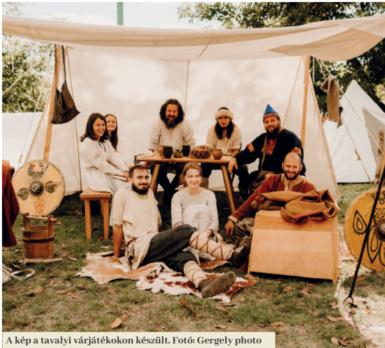
A kép a tavalyi várjátékokon készült.

A Füleki Várjátékok idén ismét Anyár végén kerülnek megrendezésre. Szeptember 3-án a várudvar különféle egyesületek és csoportok korhű öltözékbe bújt fellépőivel telik majd meg, akik jónéhány történelmi korszak életmódját, kultúráját és hagyományait mutatják be. A jelenlegi, XXII. évad az előző évi rendezvény időrendi folytatása. Betekintést nyújt Fülek és környéke történetébe, kiemelve ezúttal a késői középkortól a második világháborúig terjedő időszakot.