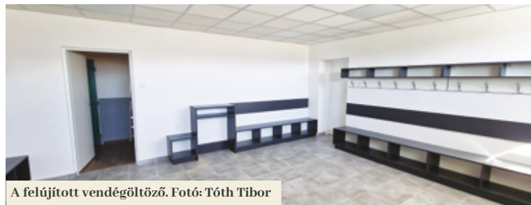
A felújított vendégöltöző.

Az FTC stadionja új vendégöltözővel és rendelővel gyarapodott. Az önkormányzatnak sikerült e célra a Szlovák Labdarúgó-szövetségtől (SZLSZ) támogatást szerezni. Az elkövetkező hetekben a hazai csapat öltözője is kész lesz.