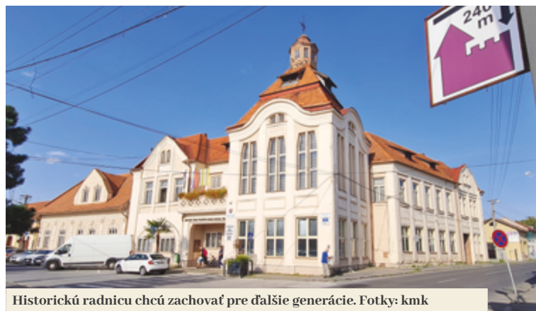
Historickú radnicu chcú zachovať pre ďalšie generácie.

Podľa primátora projekt počítá aj s využívaním smart technológií. Tie majú zabezpečiť úsporu na nákladoch a zefektívniť energetickú hospodárnosť budovy. „Systém bude reagovať na vonkajšiu teplotu a na základe nej kúriť v potrebných časoch, kedy je úrad otvorený. Vo zvyšku dňa bude nastavený na temperovanie. Bude sa dať napláňovať kúrenie v presne určených časoch aj vo väčších, nepravidelne využívaných sálach, automaticky podľa kalendára zasadnutí či obradov. Vykurovať bude postupne v dlhších intervaloch, nie skokovo, čím sa ušetrí veľké množstvo energie. Smart technológie budú ovlá-