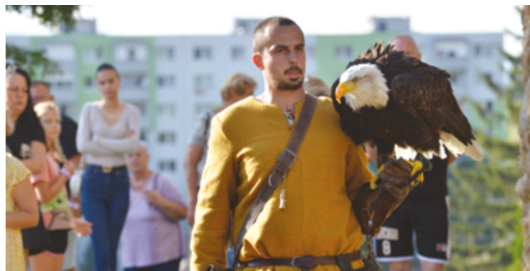
Vďaka Sokoliarstvu Kanát sa mohli účastníci presvedčiť o šikovnosti a schopnostiach dravých vtákov a dozvedieť sa niečo o ich chove a spôsobe života.