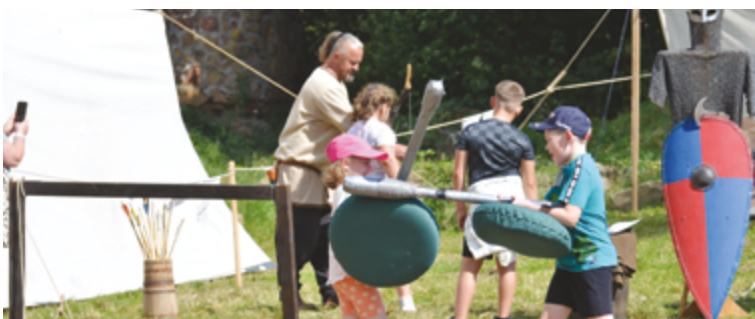
V rámci sprievodného programu priblížila šermiarska skupina Vir Fortis a dobre známi obrancovia spolku Defensores život vo vojenských táboroch, bojové techniky a zbrane, či bežný život našich predkov. V prvom tábore si záujemcovia mohli vyskúšať zakladanie ohňa kresadlom, odlievanie olovených guľiek a sekacie šablou, kým v druhom mali možnosť sa zapojiť do interaktívnych programov a prejsť rytierskou dráhou.