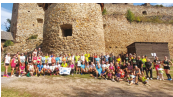
Na podujatí sa zúčastnilo 140 bežcov.

Ocenení boli rozdelení do kategórií - muži a ženy do 39 rokov a nad 40 rokov, v Nordic walking bez vekových kategórií. Víťazi dostali darčeky od spoločnosti Thorma Výroba s.r.o., OZ Pivničný rad a veľkoskladu Caritas s.r.o. Absolútni víťazi - najrýchlejší bežci na 5- aj 10-kilometrovej trati