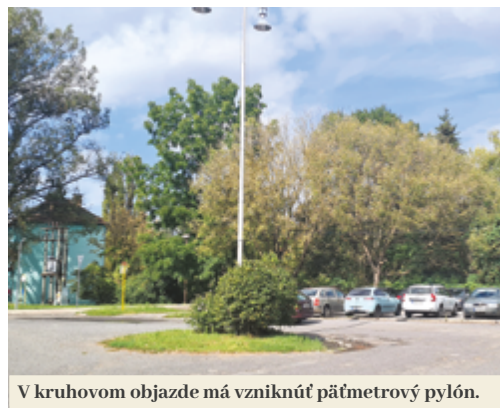
V kruhovom objazde má vzniknúť päť metrový pylón.

orientačným bodom pre obyvateľov prichádzajúcich na stanicu i cestujúcich prichádzajúcich zo železničnej stanice. Okolo pylónu počítajú s rozmiestnením lavičiek. Súčasťou rekonštrukcie by mala byť aj výmena a osadenie nového verejného osvetlenia s úspornými LED lampami.