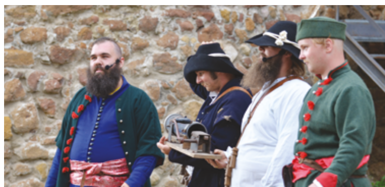
Podujatie sa uskutočnilo s finančnou podporou Fondu na podporu kultúry národnostných menšín a Banskobystrického samosprávneho kraja.

Text: HMF - NTIC