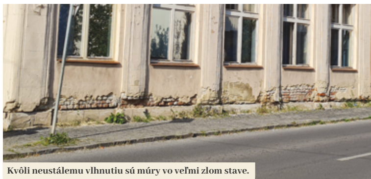
Kvôli neustálemu vlhnutiu sú múry vo veľmi zlom stave.