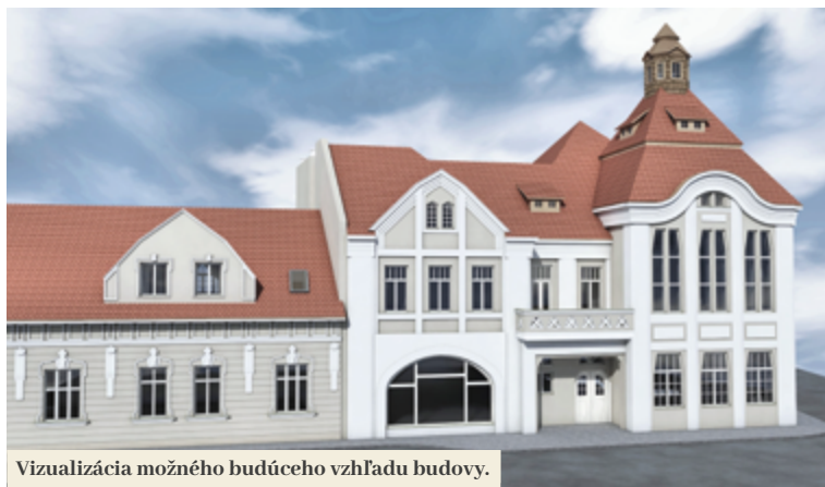
Vizualizácia možného budúceho vzhľadu budovy.

dať aj vonkajšie žalúzie na južnej časti budovy. V letných dňoch budú mimo úradné hodiny zatvorené a otvoria sa iba tesne pred pracovnou dobou. Budova sa bude menej prehrievať, vďaka čomu bude v lete plynulejšie fungovať aj chod úradu a poskytovanie služieb pre občanov,“ doplnil.