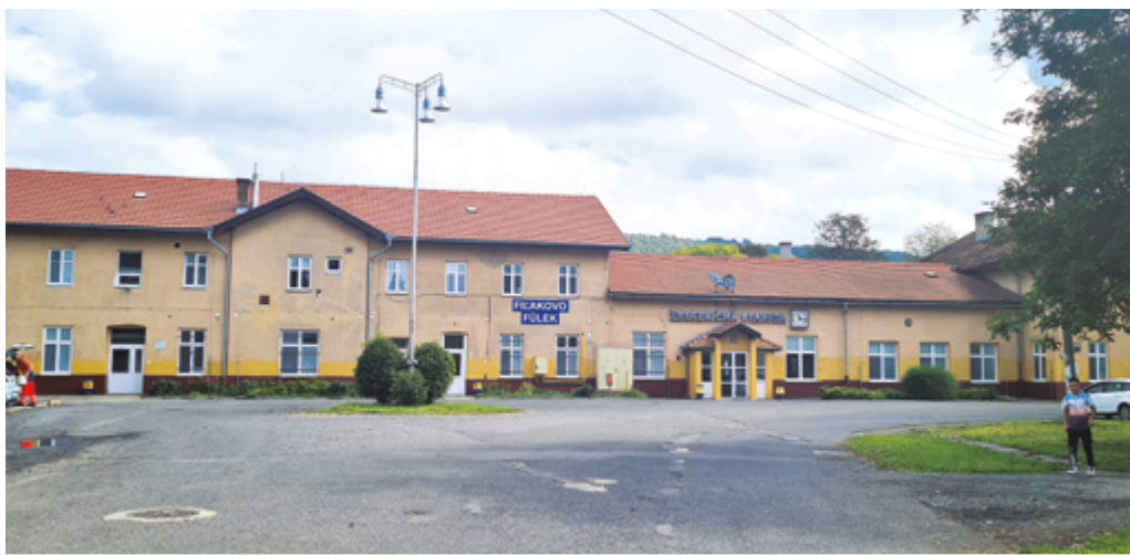
Hlavná železničná stanica má byť v plnej prevádzke opäť po rekonštrukcii trate medzi Lučencom a Filakovom.

Pokiaľ bude projekt úspešný, pribudne v lokalite aj nový mobiliár. V strede kruhového objazdu má vzniknúť nový objekt, päť metrový pylón, ktorý by sa mal podľa Anderkovej stať