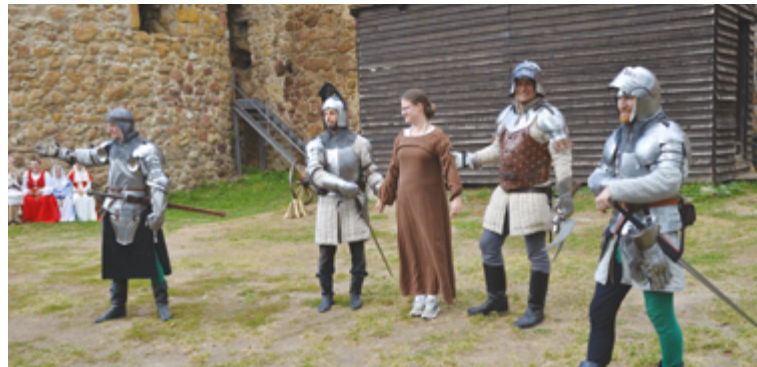
Historická skupina ťažkej pechoty Börzsöny hodnoverne predstavila zbrane, bojové zdatnosti, odev a zbroje 14. a 15. storočia, ba dokonca zinscenovala aj dobový bosorácky proces.