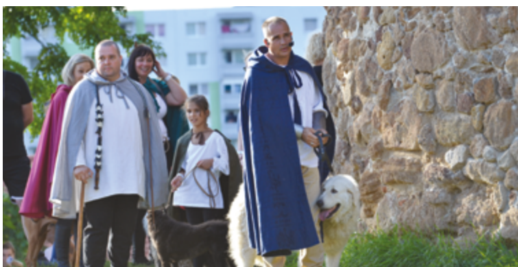
Pozornosť divákov upúťali aj ukážky historických plemien pastierskych a loveckých psov skupiny Stredovekých kráľovských chovateľov psov.