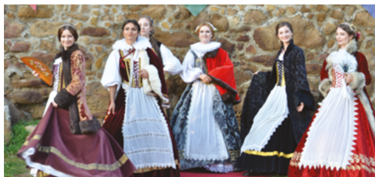
Zaujímavým spretrením programu boli ukážky autentického odevu z doby renesancie a baroka formou módnej prehliadky. Úchvatné kostýmy a doplnky najznámejších predstaviteľiek strednej a vyššej šľachty Uhorska, zhotovené na základe dobových prameňov, nám predstavili členovia Spoločnosti Fringia.