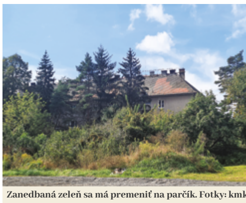
Zanedbaná zeleň sa má premeniť na parčík.