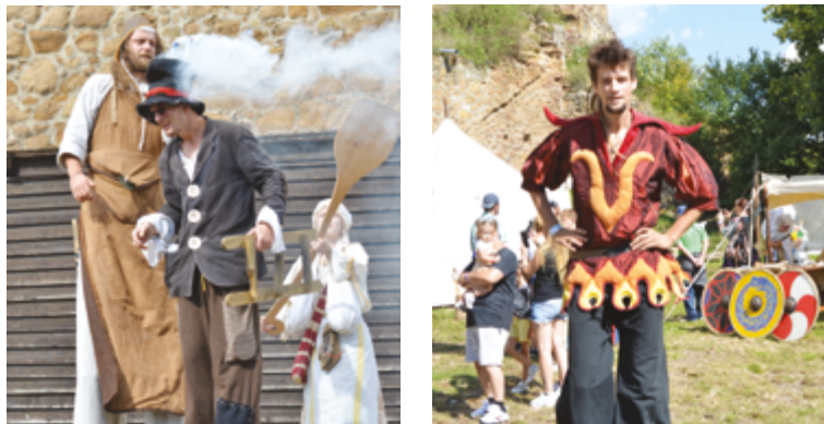
Podujatie zahájilo chodúľové divadelné predstavenie pre deti, o zábavu ktorých sa počas celého dňa starali aj historickí komedianti.

Hradné múzeum má za sebou ďalší ročník Filakovských hradných hier. Toto dlhoročne obľúbené podujatie láka záujemcov z tuzemska aj z Maďarska. Je medzi nimi mnoho stálych, ale v tomto roku aj veľa náhodných návštevníkov, ktorých spravidla príjemne prekvapí autentický a obsažný program. Nebolo tomu inak ani teraz, kedy sa mohli oboznámiť s každodenným životom, kultúrou, tradíciami a bojovými technikami z obdobia fungovania hradu. Tohtoročný program si prišlo pozrieť vyše 1000 záujemcov.