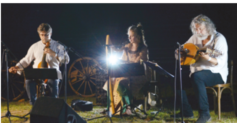
Hradné hry ukončil večerný koncert renesančnej a barokovej hudby v podaní skupiny Vox Humana.