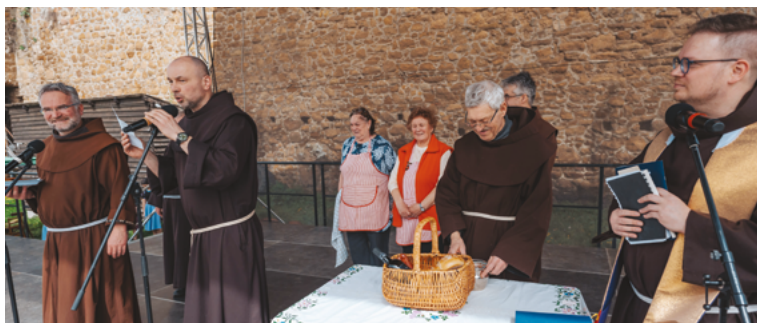
Déliidőben a Füleki Római Katolikus Plébánia ferences rendi szerzetesei szentelték meg a hagyományos húsvéti ételeket. A szertartás fenyvét szlovák és magyar nyelven felcsendülő liturgikus és egyházi énekek emelték.