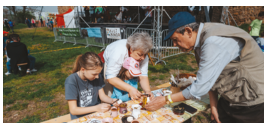
A kísérőprogramok egyik alappillére a Motolla Kézműves Baráti Kör mesterei által nyújtott foglalkozások sora volt. Többek között a tojásdíszítés különböző technikáit a gyékényezés és a nemezelés alapjait sajátíthatták el az érdeklődők.