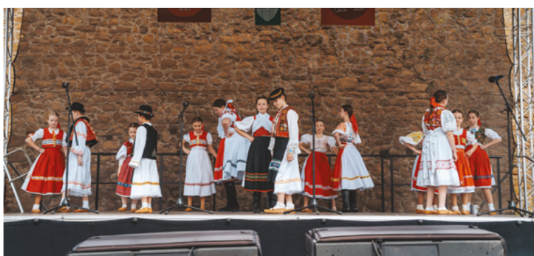
A Jánošík Gyermekek-néptáncgyűttes műsora a húsvéti hagyományokból nyújtott ízelítőt.