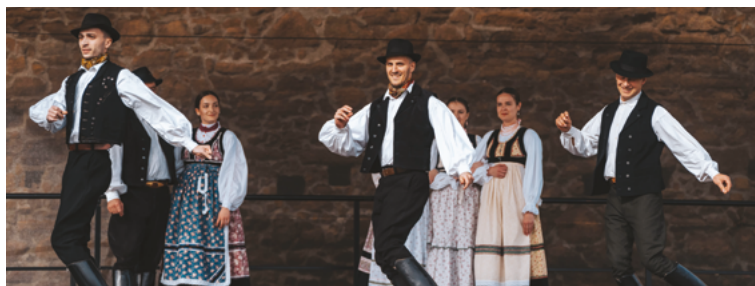
A színpadi programok sorát a Szécsényből érkezett Palóc Néptáncgyűttes és a debreceni Bakator zenekar nyitotta. Palócföld táncgyományain kívül a magyar nyelvterület egyéb vidékeinek táncait is magas színvonalon közvetítették az egyre gyarapodó közönség felé. Szöveg és fotók- VMK