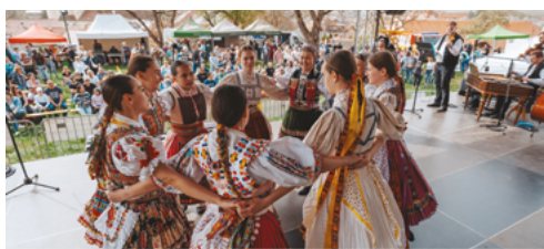
A nógrádi szlovák folklór a bozítai Dubkácik Hagyományőrző Együttes színvonalas műsorának köszönhetően öltött színpadi formát. Öröm volt látni hogyan kelnek újra életre az általuk összegyűjtött eredeti népviseletek. Bemutkozásukat a nagyszaltnai Podjavorská Muzika zenekar tette teljessé.