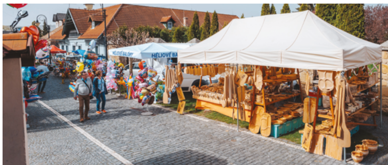
Már kora reggel árusok népes tábora települt ki a várudvarba és a Várfelső utcába, a nap folyamán csaknem 1300 látogatót fogadott a rendezvény a várudvaron.