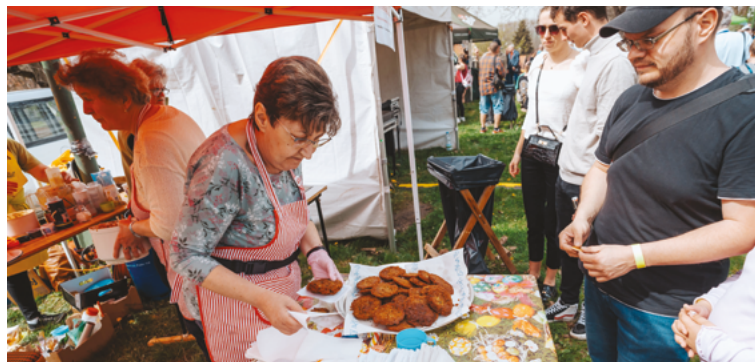
Időközben ínycsiklandozó illatok hirdették elkészült a Banya-társulat tócsnija, megsült a bárány, melyet a Defensores történelmi csoport korabeli ruhákban tállalt.