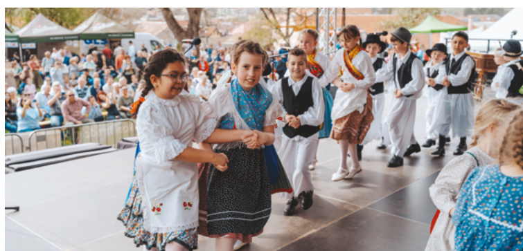
A II. Koháry István Alapiskola mellett működő Szederinke Gyermekek-néptáncgyűttes a virágvasárnaptól húsvéthétfőig tartó hagyományokat elevenítette fel.