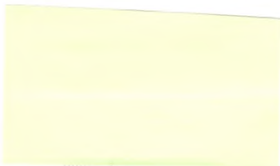
Pečiatka a podpis poistníka

„Poistník prehlasuje, že mu bol daný písomný súhlas a je splnomocnený poistenými osobami na uvedenie ich osobných údajov v poistnej zmluve a udelenie súhlasu poisťovni, aby ich osobné údaje získané v súvislosti s poistnou zmluvou, vrátane údajov o zdravotnom stave, spracovávala v rámci svojej činnosti v poisťovníctve po dobu nevyhnutnú pre zabezpečenie výkonu práv a plnenie povinností vyplývajúcich z tejto zmluvy a poskytovala ich do iných štátov, pokiaľ to bude potrebné pre zabezpečenie výkonu práv a plnenie povinností z poistnej zmluvy, pri poradenskej činnosti v oblasti poisťovníctva, ako aj ostatným subjektom podnikajúcim v poisťovníctve a združeniam týchto subjektov.“ (odstavec nie je potrebný ak ide o poistenie nemenovaných osôb)